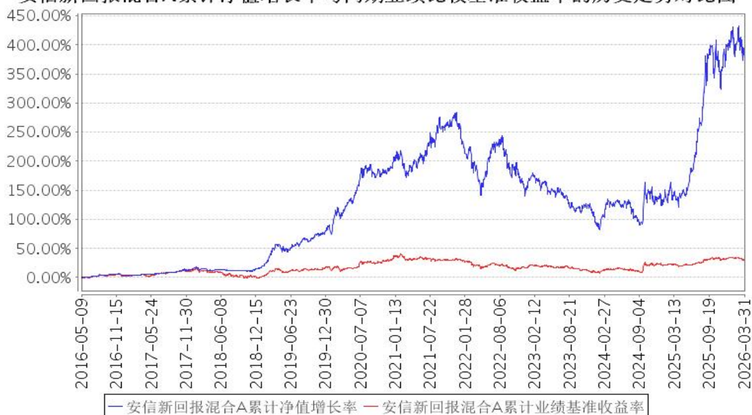
安信新回报混合A累计净值增长率与同期业绩比较基准收益率的历史走势对比图