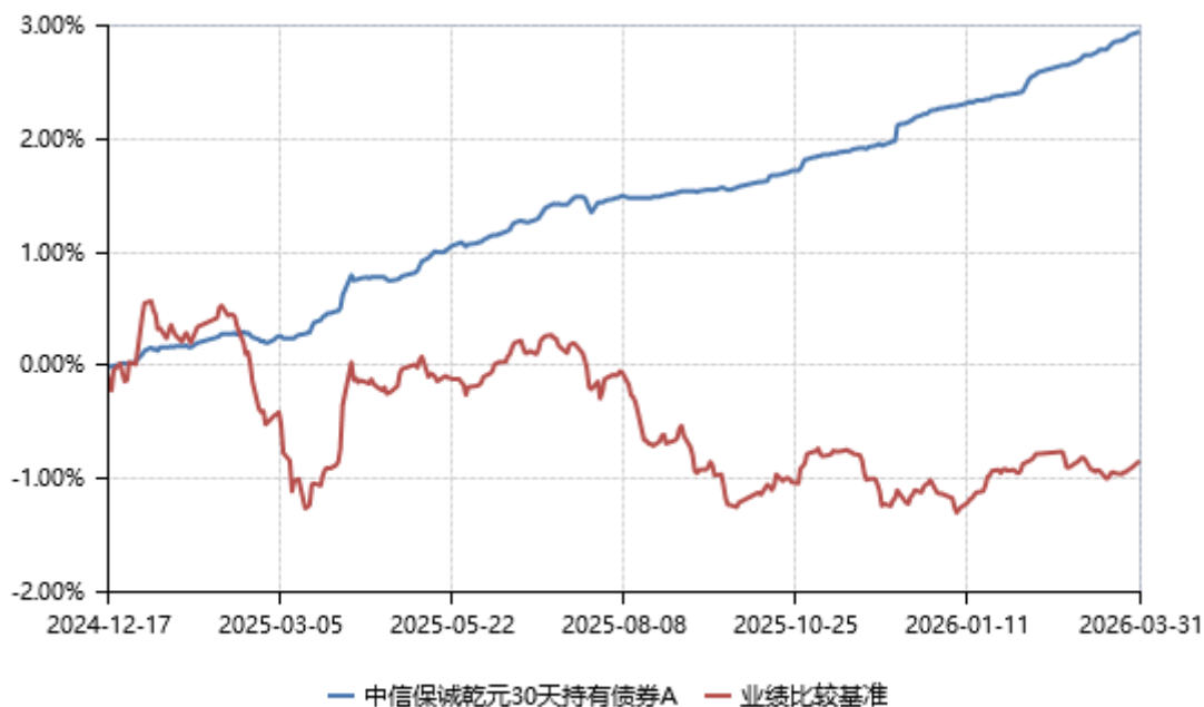
中信保诚乾元 30 天持有债券 A