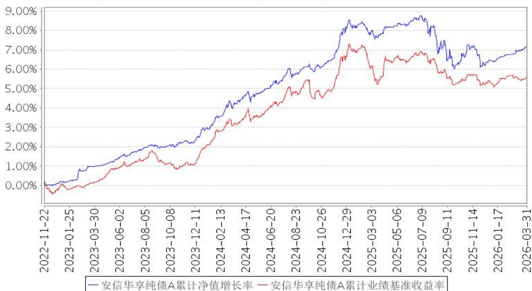
安信华享纯债A累计净值增长率与同期业绩比较基准收益率的历史走势对比图