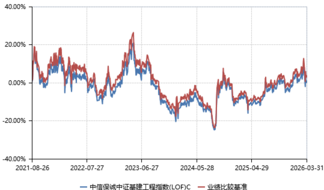
中信保诚中证建筑工程指数(LOF)E