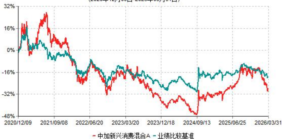
中加新兴消费混合A累计净值增长率与业绩比较基准收益率历史走势对比图 (2020年12月09日-2026年03月31日)