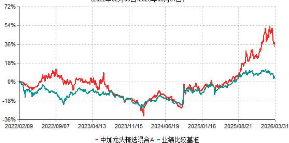
中加龙头精选混合A累计净值增长率与业绩比较基准收益率历史走势对比图 (2022年02月09日-2026年03月31日)