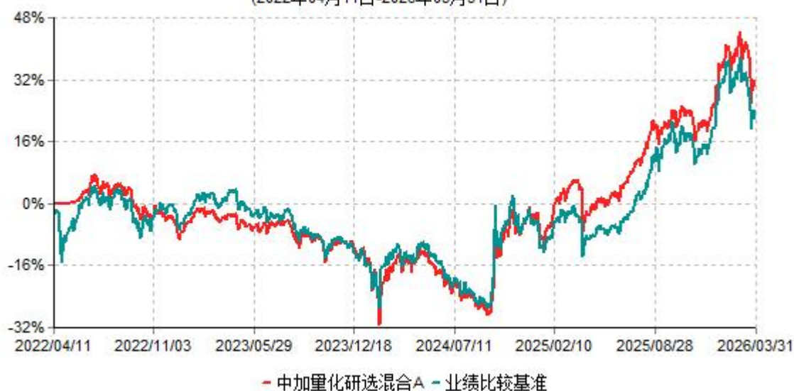
中加量化研选混合A累计净值增长率与业绩比较基准收益率历史走势对比图 (2022年04月11日-2026年03月31日)