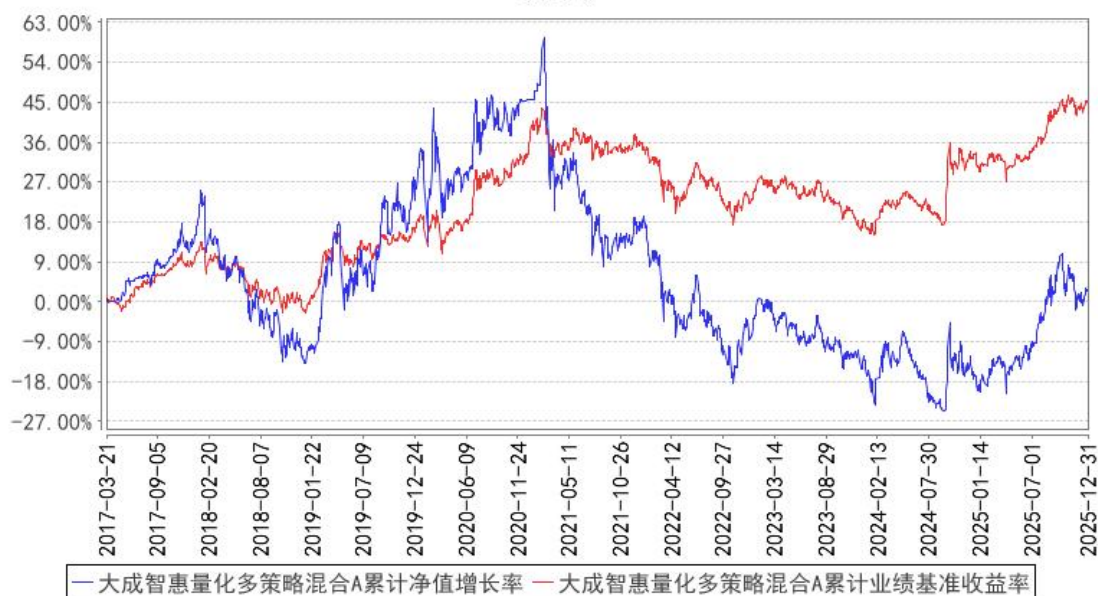
大成智慧量化多策略混合A累计净值增长率与同期业绩比较基准收益率的历史走势对比图

(二) 自基金合同生效以来基金份额累计净值增长率变动及其与同期业绩比较基准收益率变动的比较