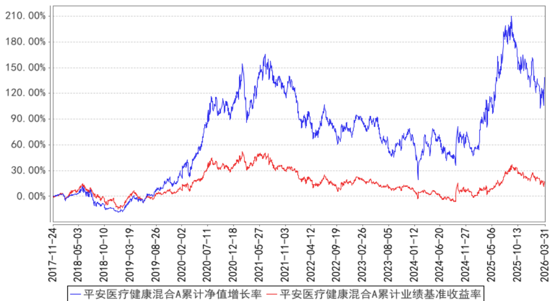
平安医疗健康混合A累计净值增长率与同期业绩比较基准收益率的历史走势对比图