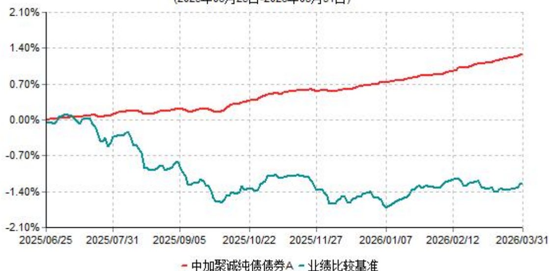
中加聚诚纯债债券A累计净值增长率与业绩比较基准收益率历史走势对比图 (2025年06月25日-2026年03月31日)