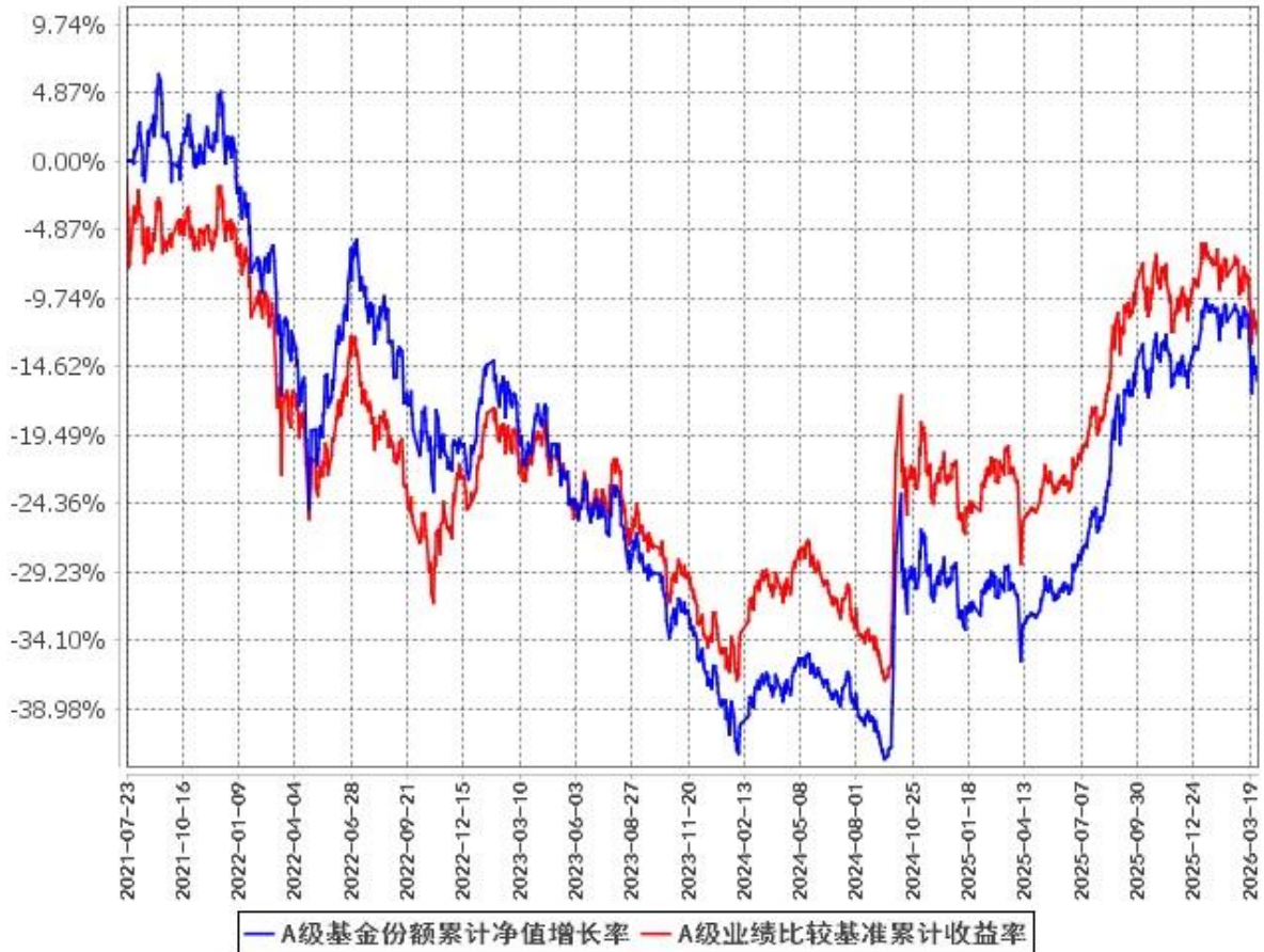
A级基金份额累计净值增长率与同期业绩比较基准收益率的历史走势对比图 (2021年7月23日至2026年3月31日)