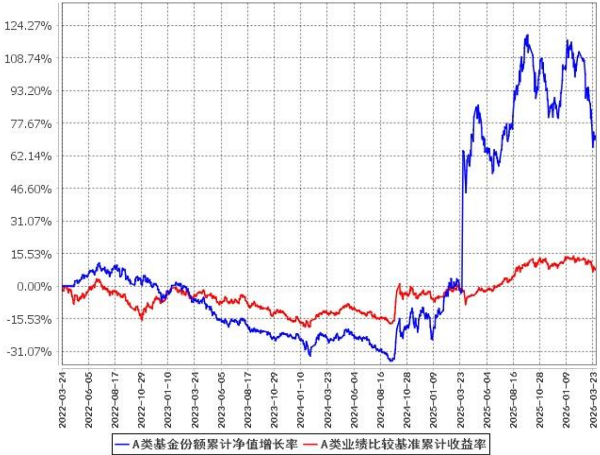
A类基金份额累计净值增长率与同期业绩比较基准收益率的历史走势对比图 (2022年3月24日至2026年3月31日)