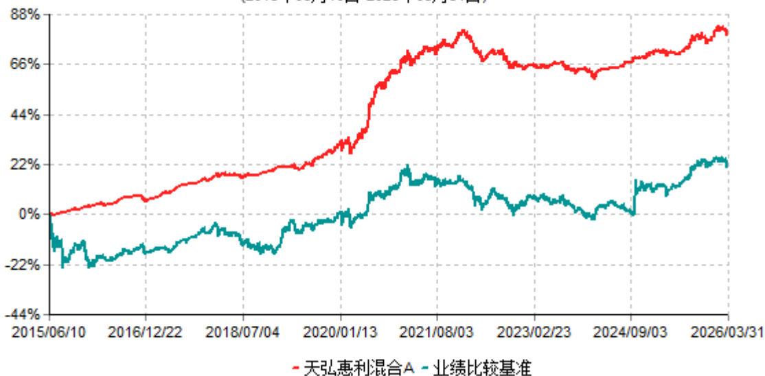
天弘惠利混合A累计净值增长率与业绩比较基准收益率历史走势对比图 (2015年06月10日-2026年03月31日)