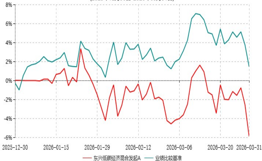
东兴低碳经济混合发起A累计净值增长率与业绩比较基准收益率历史走势对比图 (2025年12月30日-2026年03月31日)