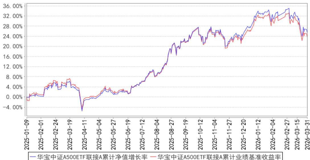
华宝中证A500ETF联接A累计净值增长率与同期业绩比较基准收益率的历史走势对比图