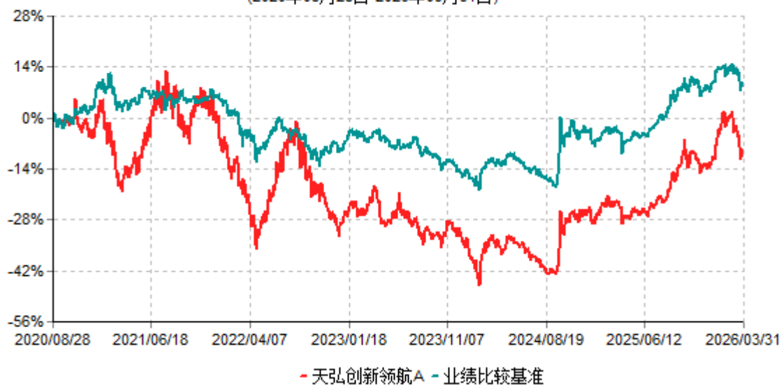
天弘创新领航A累计净值增长率与业绩比较基准收益率历史走势对比图 (2020年08月28日-2026年03月31日)