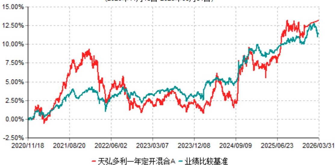
天弘多利一年定开混合A累计净值增长率与业绩比较基准收益率历史走势对比图 (2020年11月18日-2026年03月31日)