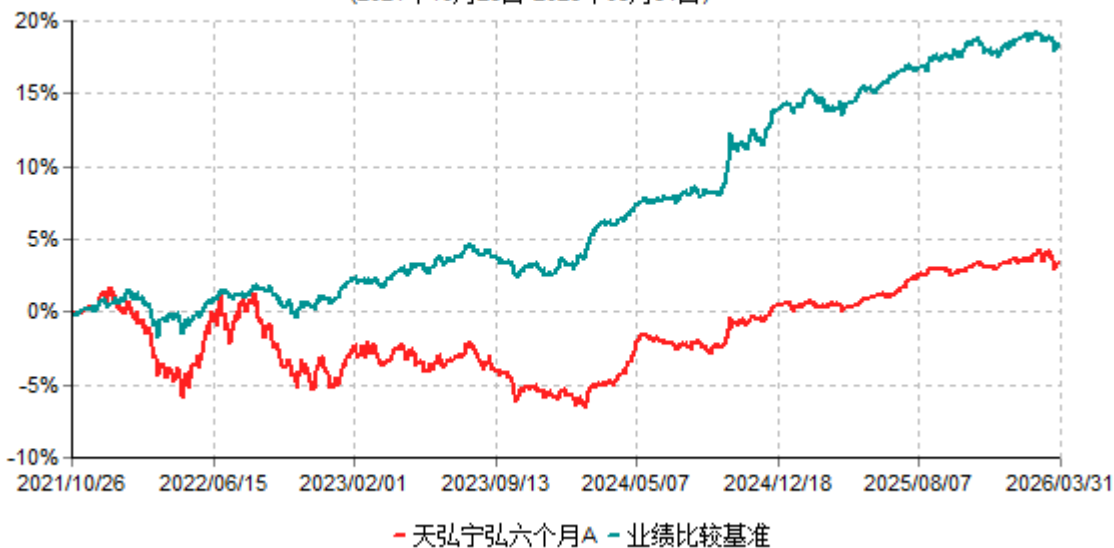
天弘宁弘六个月A累计净值增长率与业绩比较基准收益率历史走势对比图 (2021年10月26日-2026年03月31日)