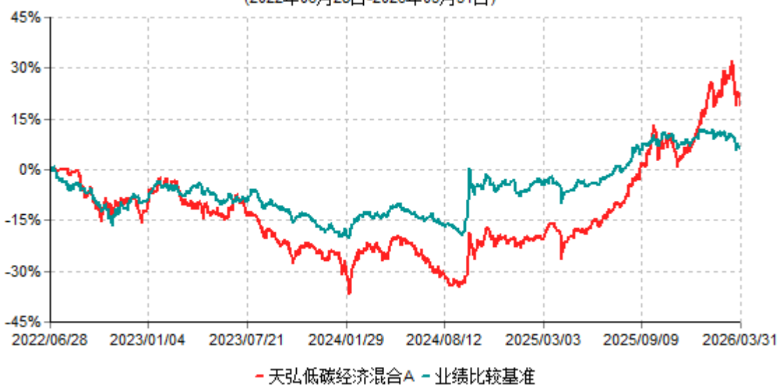
天弘低碳经济混合A累计净值增长率与业绩比较基准收益率历史走势对比图 (2022年06月28日-2026年03月31日)