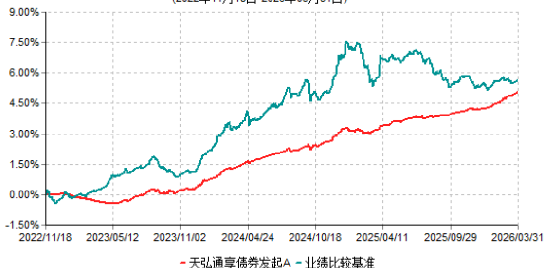
天弘通享债券发起A累计净值增长率与业绩比较基准收益率历史走势对比图 (2022年11月18日-2026年03月31日)