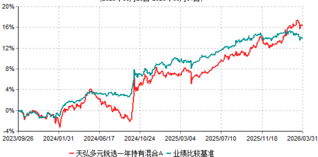
天弘多元锐选一年持有混合A累计净值增长率与业绩比较基准收益率历史走势对比图 (2023年09月26日-2026年03月31日)