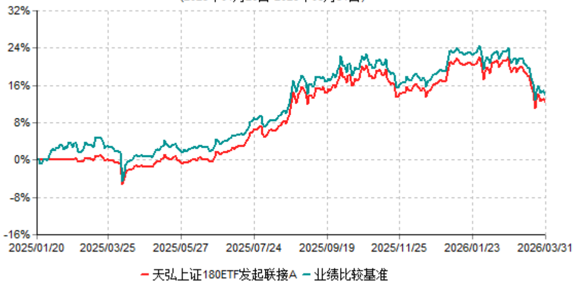
天弘上证180ETF发起联接A累计净值增长率与业绩比较基准收益率历史走势对比图 (2025年01月20日-2026年03月31日)