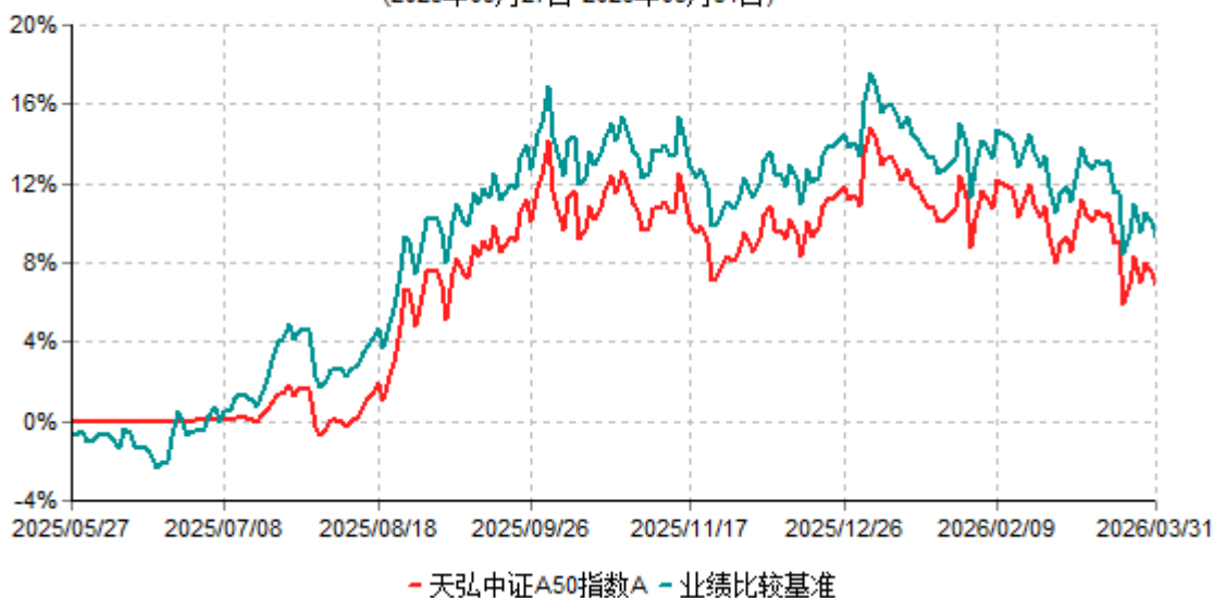
天弘中证A50指数A累计净值增长率与业绩比较基准收益率历史走势对比图 (2025年05月27日-2026年03月31日)