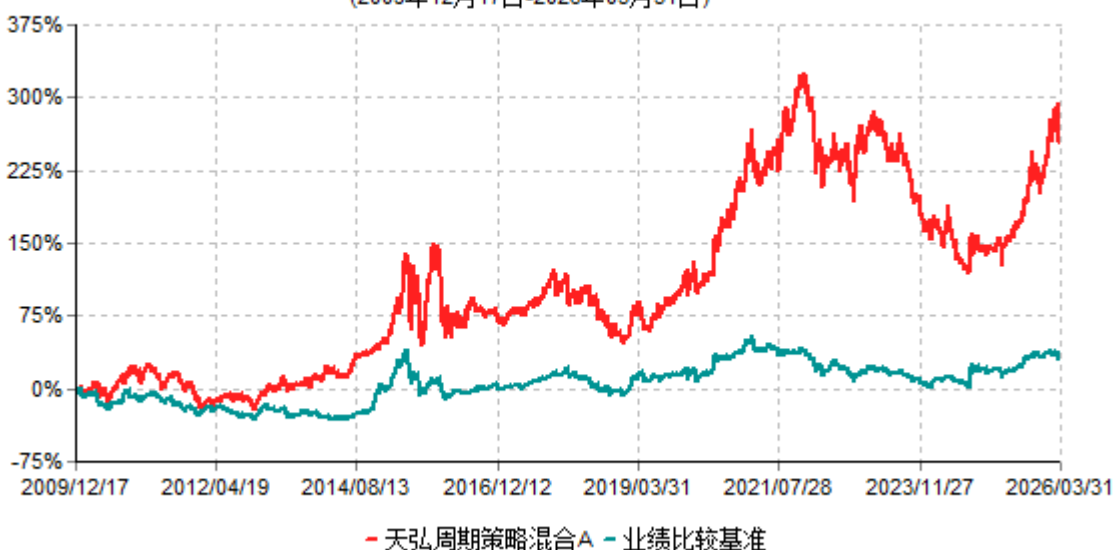
天弘周期策略混合A累计净值增长率与业绩比较基准收益率历史走势对比图 (2009年12月17日-2026年03月31日)