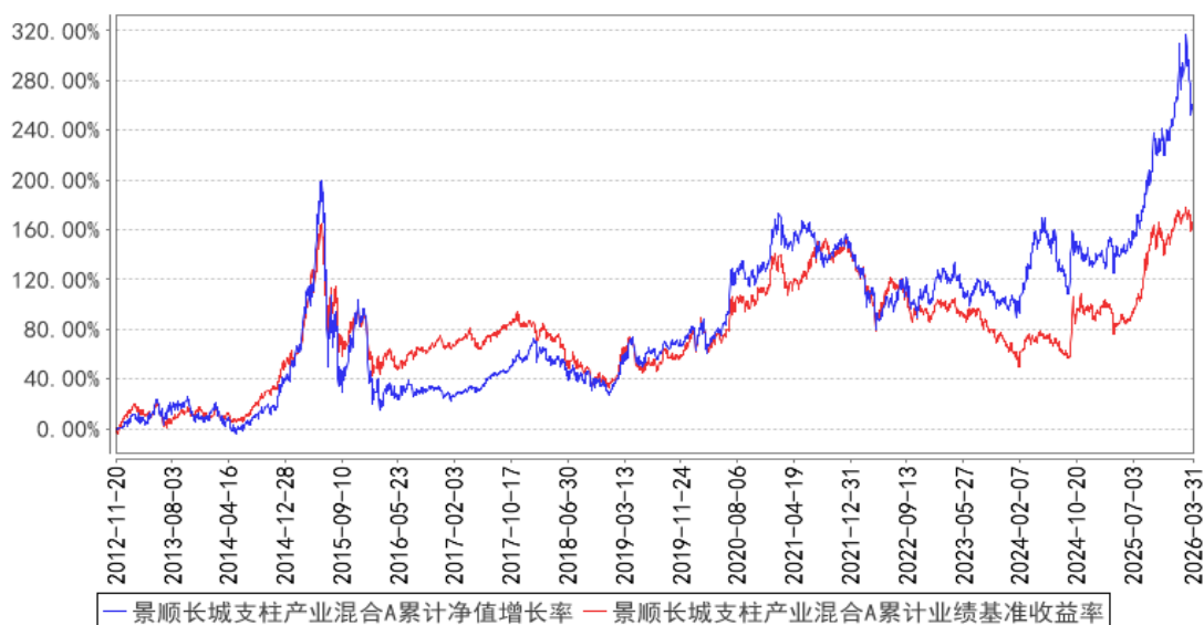
景顺长城支柱产业混合A累计净值增长率与同期业绩比较基准收益率的历史走势对比图