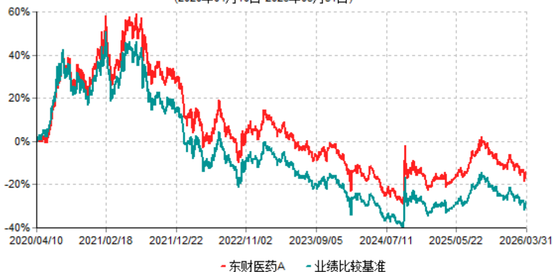
东财医药A累计净值增长率与业绩比较基准收益率历史走势对比图 (2020年04月10日-2026年03月31日)