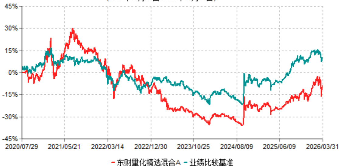
东财量化精选混合A累计净值增长率与业绩比较基准收益率历史走势对比图 (2020年07月29日-2026年03月31日)