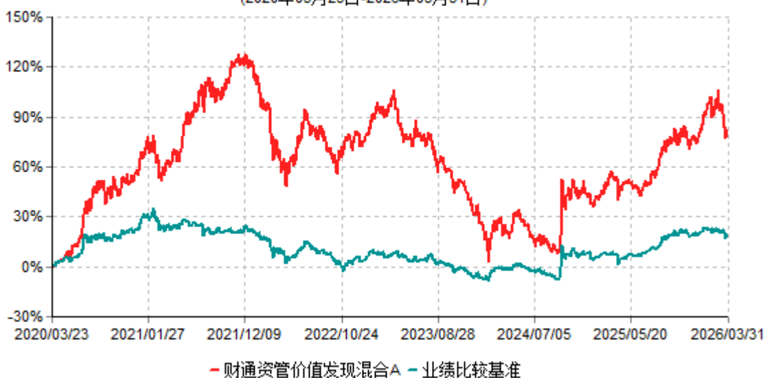
财通资管价值发现混合A累计净值增长率与业绩比较基准收益率历史走势对比图 (2020年03月23日-2026年03月31日)