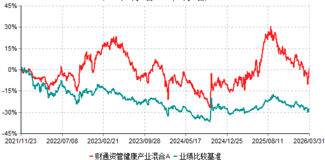
财通资管健康产业混合A累计净值增长率与业绩比较基准收益率历史走势对比图 (2021年11月23日-2026年03月31日)