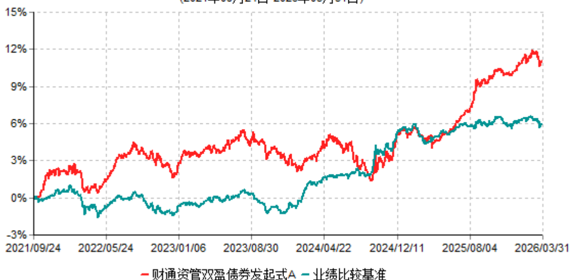
财通资管双盈债券发起式A累计净值增长率与业绩比较基准收益率历史走势对比图 (2021年09月24日-2026年03月31日)