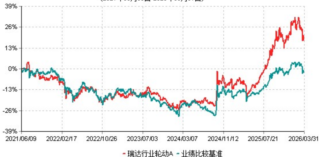
瑞达行业轮动A累计净值增长率与业绩比较基准收益率历史走势对比图 (2021年06月09日-2026年03月31日)