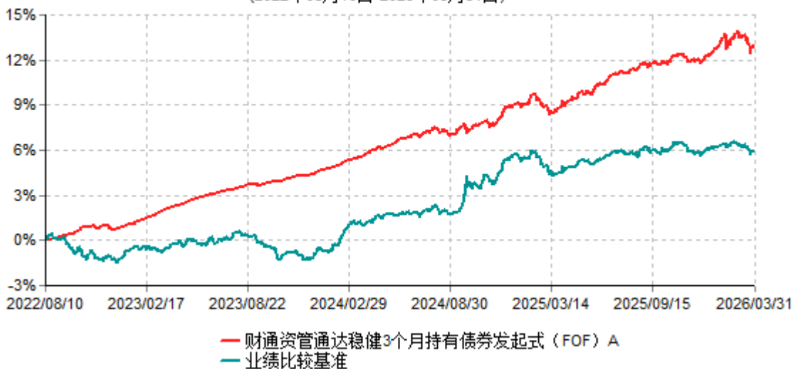
财通资管通达稳健3个月持有债券发起式（FOF）A累计净值增长率与业绩比较基准收益率历史走势对比图 (2022年08月10日-2026年03月31日)