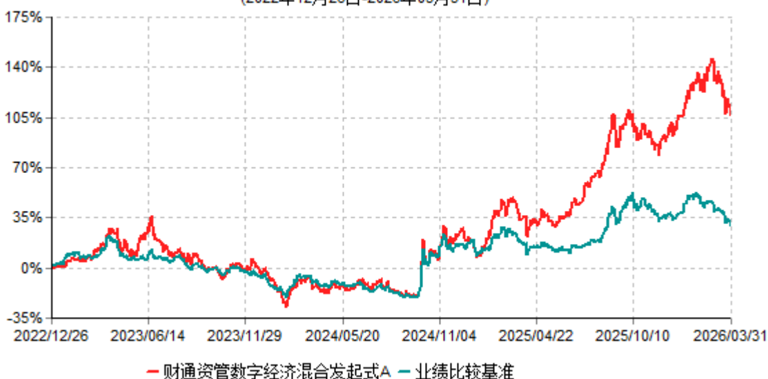
财通资管数字经济混合发起式A累计净值增长率与业绩比较基准收益率历史走势对比图 (2022年12月26日-2026年03月31日)