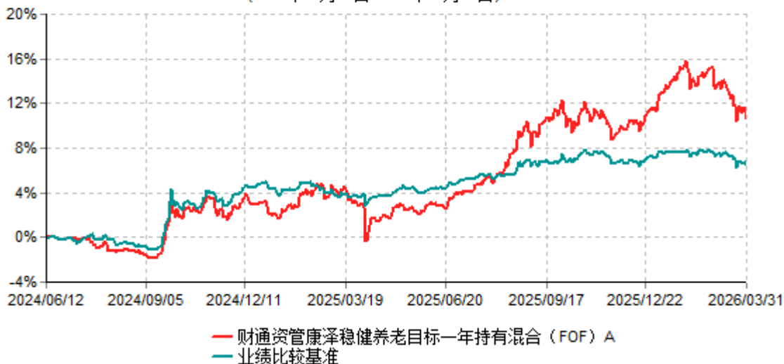
财通资管康泽稳健养老目标一年持有混合（FOF）A累计净值增长率与业绩比较基准收益率历史走势对比图 (2024年06月12日-2026年03月31日)