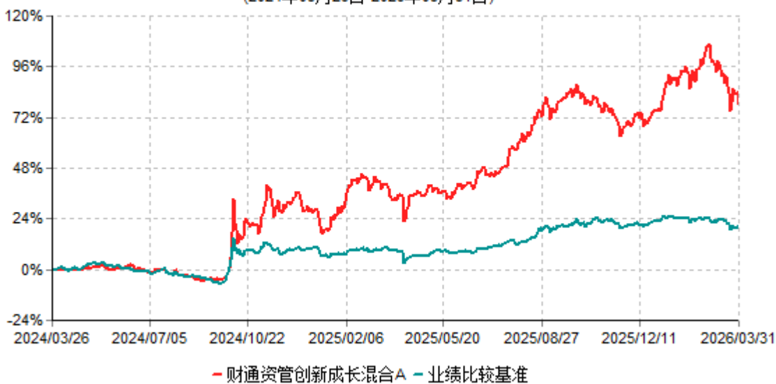
财通资管创新成长混合A累计净值增长率与业绩比较基准收益率历史走势对比图 (2024年03月26日-2026年03月31日)