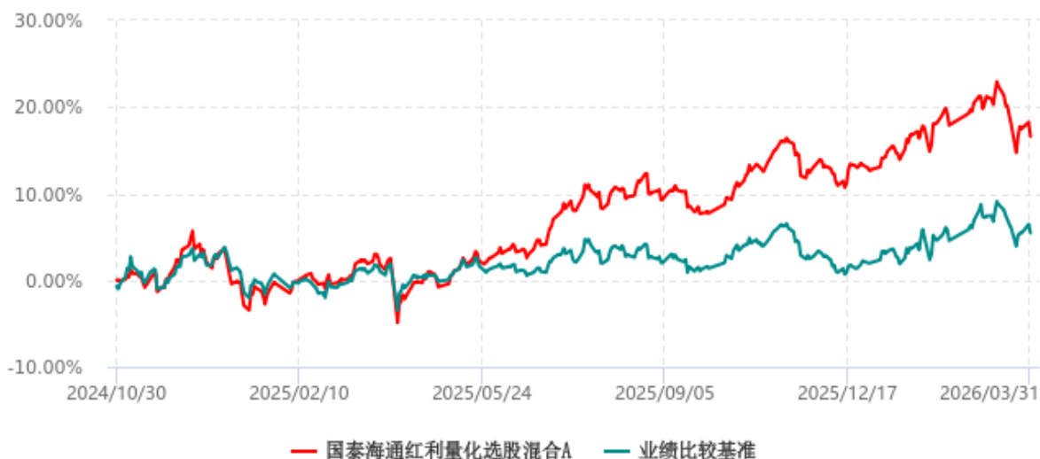
国泰海通红利量化选股混合A累计净值增长率与业绩比较基准收益率历史走势对比图 (2024年10月30日-2026年03月31日)

注：按基金合同和招募说明书的约定，本基金的建仓期为六个月，建仓期结束时各项资产配置比例符合基金合同的有关约定。