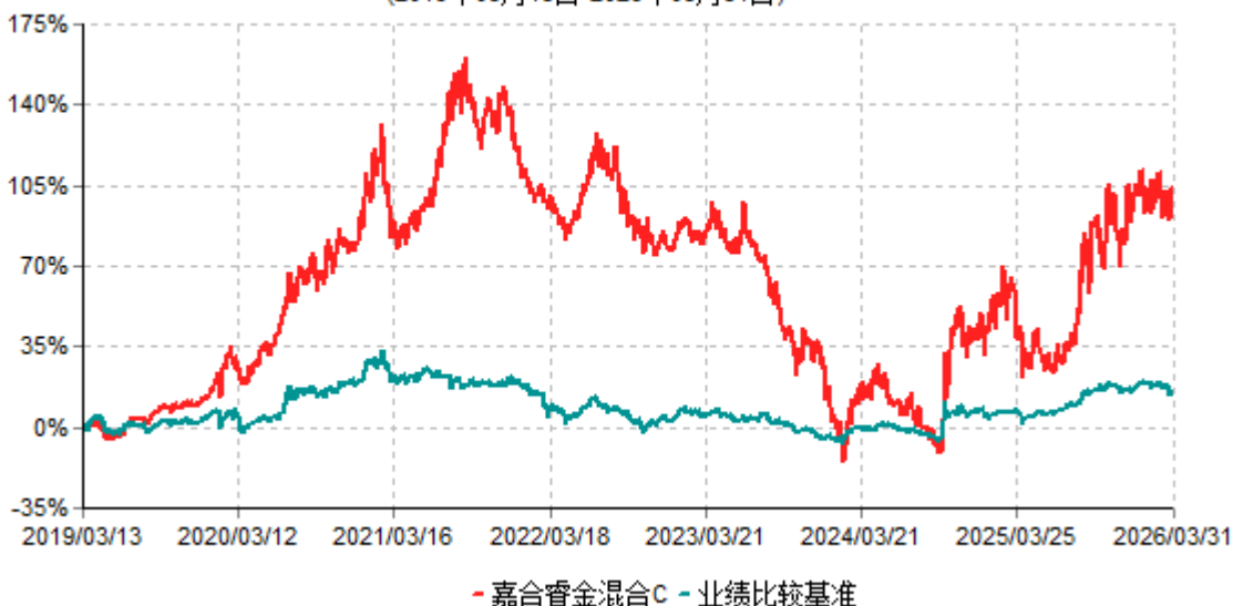
嘉合睿金混合C累计净值增长率与业绩比较基准收益率历史走势对比图 (2019年03月13日-2026年03月31日)