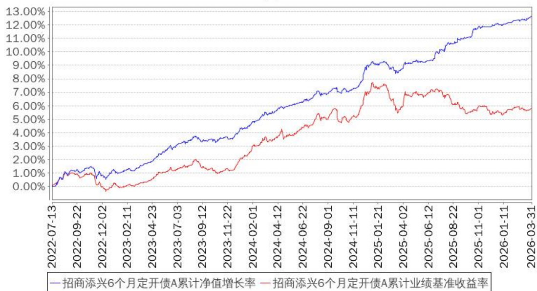
招商添兴6个月定开债A累计净值增长率与同期业绩比较基准收益率的历史走势对比图