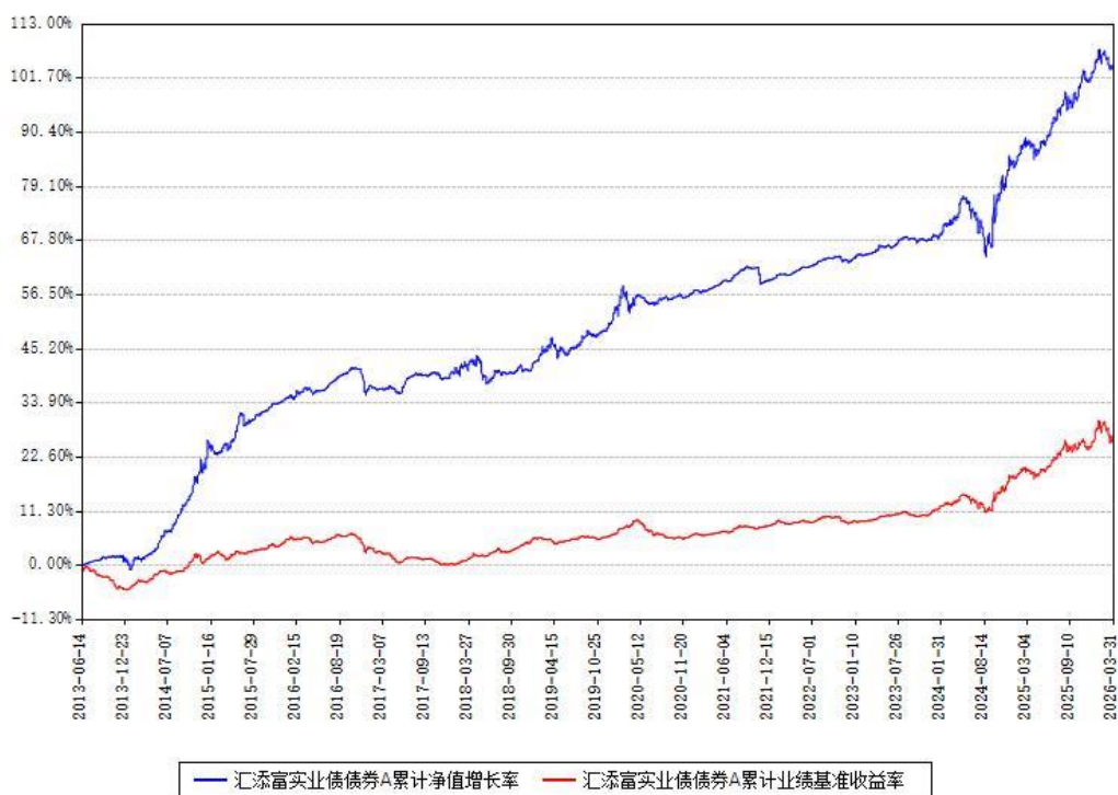
汇添富实业债债券A累计净值增长率与同期业绩基准收益率对比图