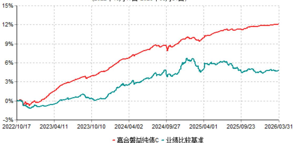
嘉合磐益纯债C累计净值增长率与业绩比较基准收益率历史走势对比图 (2022年10月17日-2026年03月31日)