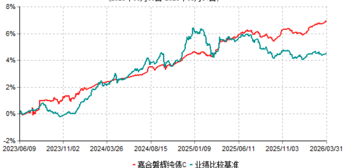
嘉合磐辉纯债C累计净值增长率与业绩比较基准收益率历史走势对比图 (2023年06月09日-2026年03月31日)