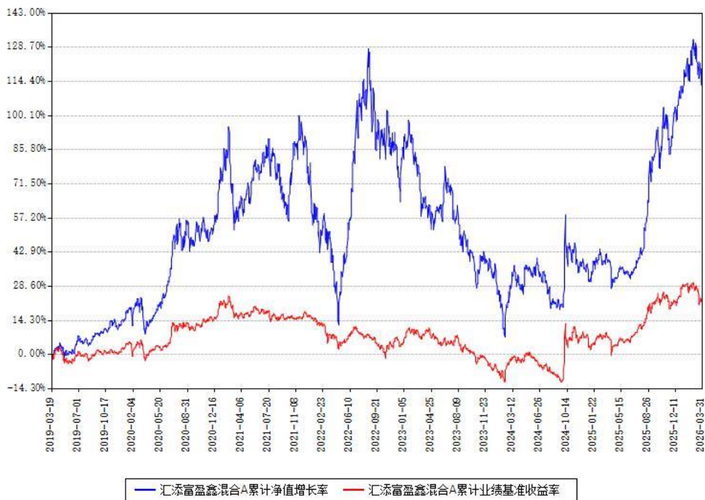
汇添富盈鑫混合A累计净值增长率与同期业绩基准收益率对比图