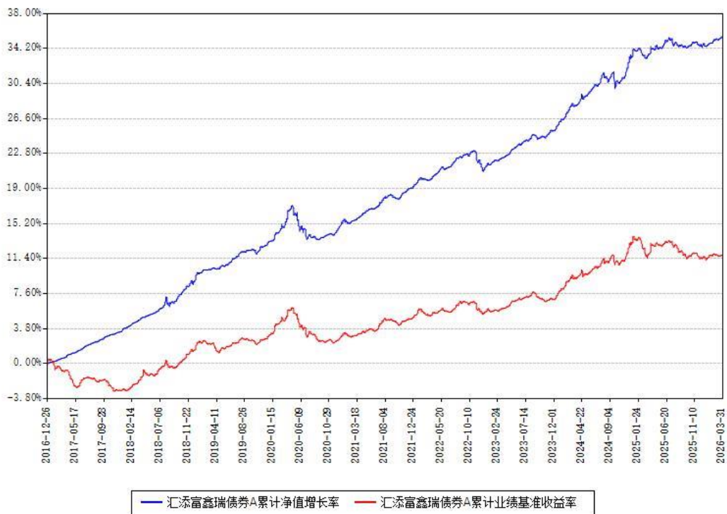
汇添富鑫瑞债券A累计净值增长率与同期业绩基准收益率对比图