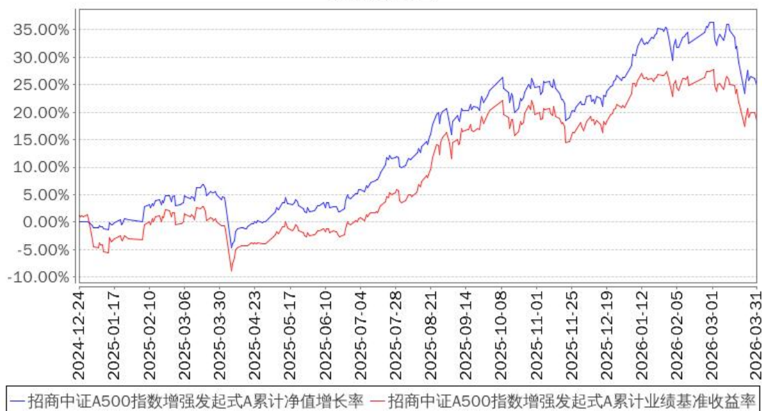
招商中证A500指数增强发起式A累计净值增长率与同期业绩比较基准收益率的历史走势对比图