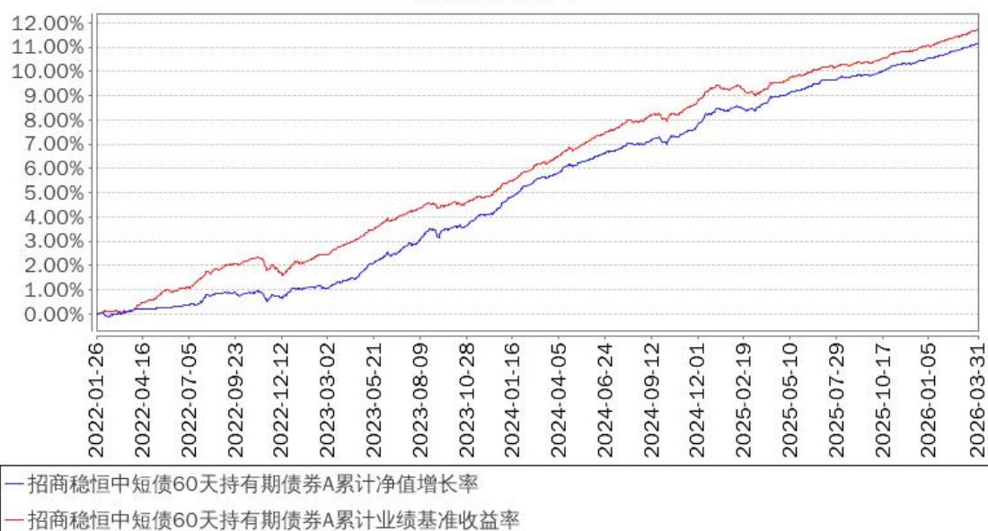
招商稳恒中短债60天持有期债券A累计净值增长率与同期业绩比较基准收益率的历史走势对比图