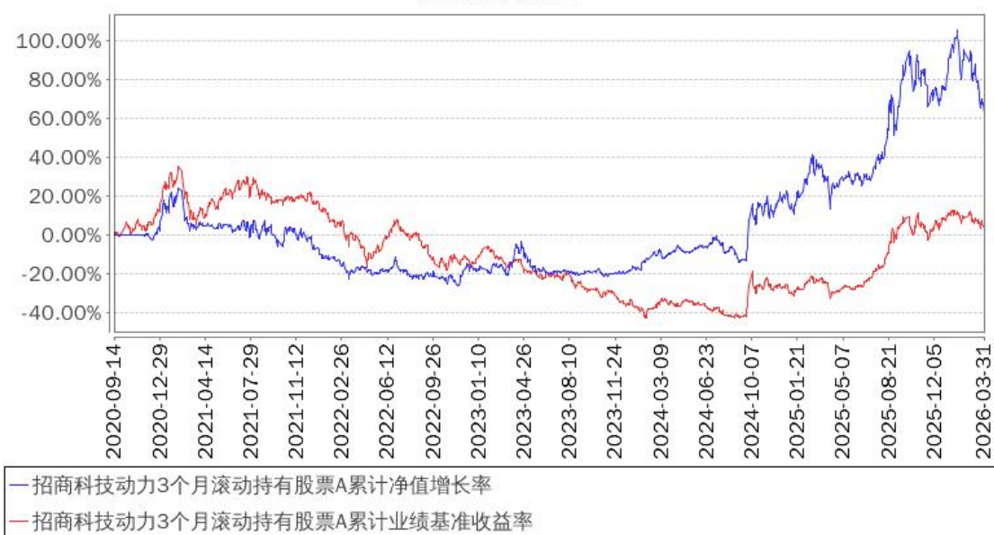
招商科技动力3个月滚动持有股票A累计净值增长率与同期业绩比较基准收益率的历史走势对比图