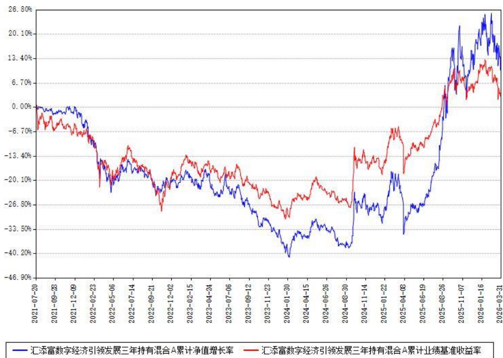
汇添富数字经济引领发展三年持有混合A累计净值增长率与同期业绩基准收益率对比图