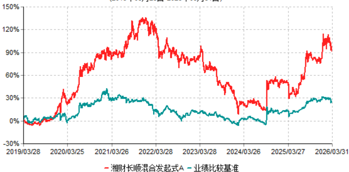
湘财长顺混合发起式A累计净值增长率与业绩比较基准收益率历史走势对比图 (2019年03月28日-2026年03月31日)