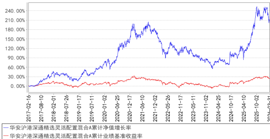
华安沪港深通精选灵活配置混合A累计净值增长率与同期业绩比较基准收益率的历史走势对比图