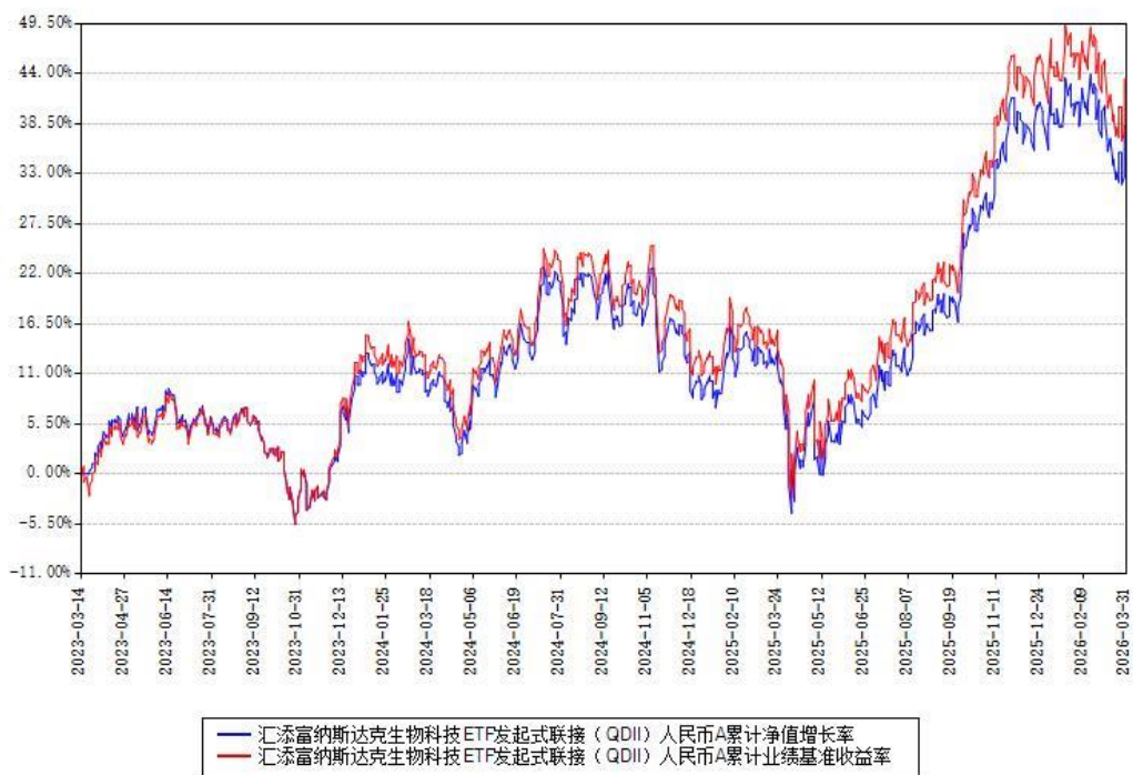
汇添富纳斯达克生物科技ETF发起式联接（QDII）人民币A累计净值增长率与同期业绩基准收益率对比图